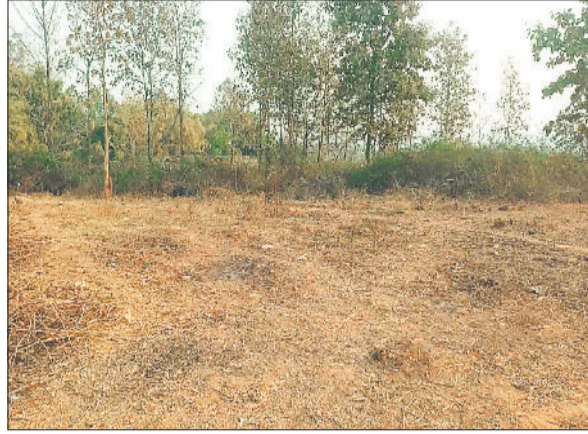
पेड़ों को काटकर बनाया गया मैदान।

वन अमले की लापरवाही से शहर से सटे महामाया पहाड़ के अस्तित्व पर बड़ा संकट उत्पन्न हो गया है। महामाया पहाड़ की सुरक्षा के उद्देश्य से वन विभाग ने पहाड़ी पर अवैध अतिक्रमण करने के साथ ही रेस्ट हाऊस सहित अन्य निर्माण किया है जहां नियमित विभाग के अधिकारी-कर्मचारियों की आवाजाही होती है साथ ही जंगल की सुरक्षा के लिए नियमित कर्मचारी भी नियुक्त हैं लेकिन वन अधिकारियों की लापरवाही से न तो पहाड़ी पर अवैध अतिक्रमण का सिलसिला रूक रहा है न ही सागौन पेड़ों की अवैध कटाई। दुर्भाग्यवश पहाड़ी के अलग-अलग हिस्से में दिनदहाड़े मरुमूक का उत्खनन कर रहे हैं। धल्ले से चल रहे अवैध कटाई एवं उत्खनन पर लोग वन अधिकारियों पर भी मिलीभगत करने का आरोप