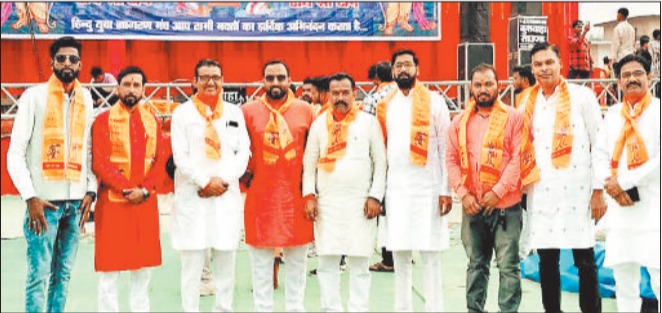
हरिभूमि न्यूज ▶▶ भैयाथान

हिंदू नववर्ष एवं चैत्र नवरात्र के पावन अवसर पर हिंदू युवा जागरण मंच के तत्वावधान में नगर में भव्य शोभा यात्रा, दीपोत्सव, भजन-संध्या, भंडारा एवं जगारते का भव्य आयोजन किया गया। पूरे नगर में धार्मिक उत्साह, श्रद्धा और उत्सास का वातावरण देखने को मिला।