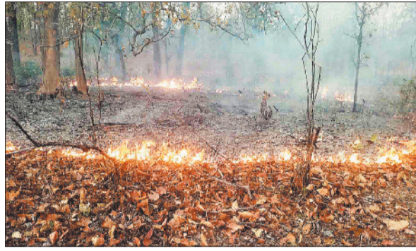
जंगल में धधकती आग।