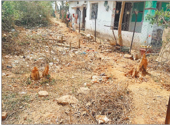
जंगल में कटे सागौन के पेड़।

महामाया पहाड़ पर लगातार बढ़ रहे अवैध अतिक्रमण एवं सागौन पेड़ों की हो रही अवैध कटाई की लगातार शिकायतों के बाद एक बार फिर वन विभाग सक्रिय हो गया है। अतिक्रमणकारियों में मंचा हड़कम्प महा माया पहाड़ी की वन भूमि पर अवैध अतिक्रमण कर रहे 166 लोगों को नोटिस जारी किया है जिससे अतिक्रमणकारियों में हड़कम्प बच गया है।